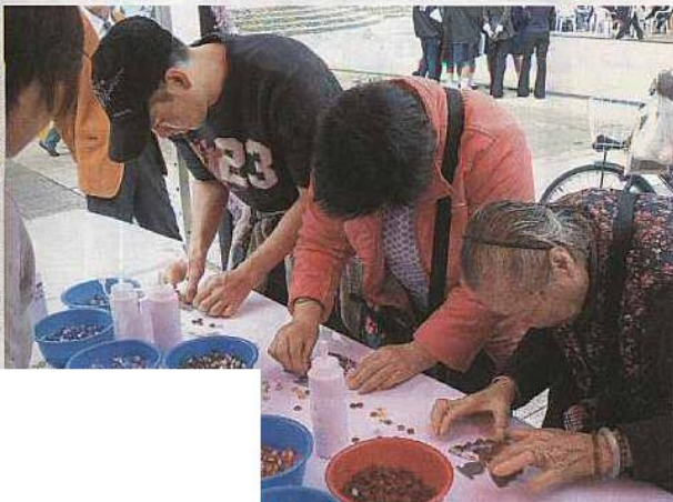
■傳說馬賽克藝術可以為居民帶來祝福。