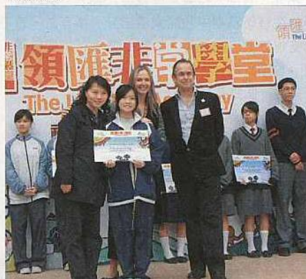
■有份參與今次馬賽克創作的同學，均獲頒發證書。