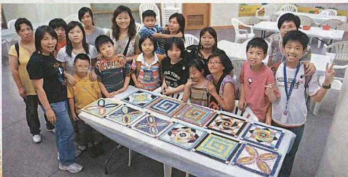
■廣場地上的馬賽克壁畫，都是區內居民努力的成果。

相傳馬賽克藝術能夠為居民帶來祝福。領匯與香港青年藝術協會早前在天水圍區合辦「社區馬賽克創作計劃」，讓區內青少年免費學習及參與創作馬賽克藝術。經歷一年時間，集合了區內760人的努力，終於完成一幅面積近750平方尺的馬賽克壁畫，並鑲嵌於天瑞歡樂廣場的地面、舞台梯級及圓柱。這次活動除讓居民親自參與建設家園外，還將祝福帶給天水圍的所有居民。