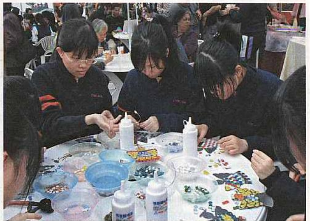
■廣場上的兩條支柱由區內兩間中學負責，一批同學在場示範製作馬賽克。